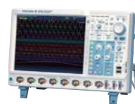
横河計測様 ミックスドシグナルオシロスコープ