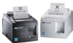
スター精密様 USBプリンタ