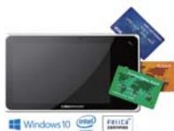
エンパシ様 オールインワン決済デバイス